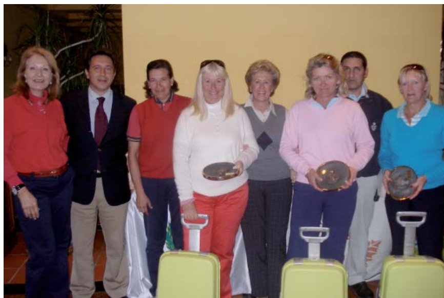
1 er. Equipo Clasificado - "Los Arqueros A"