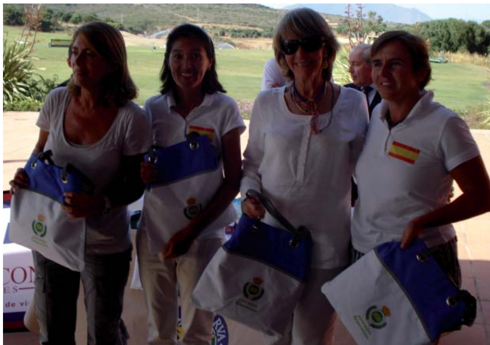
Equipo Ganador-Circuito Internacional Femenino

También se jugó la Competición Paralela, cuyos resultados fueron los siguientes: